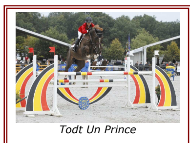
Todt Un Prince

Institut français du cheval et de l'équitation